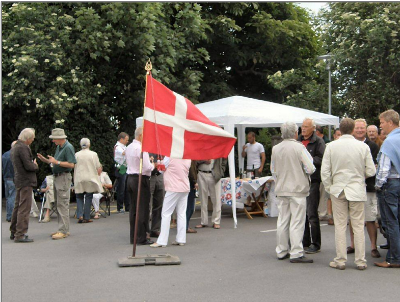
35 skydebrødre var mødt op i "Bondegårdens baghave".