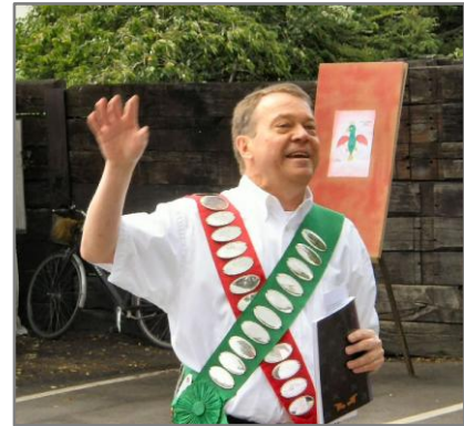
Fuglekongen holdt dagens jubilæumstale og præsenterede jubilæumshæftet.