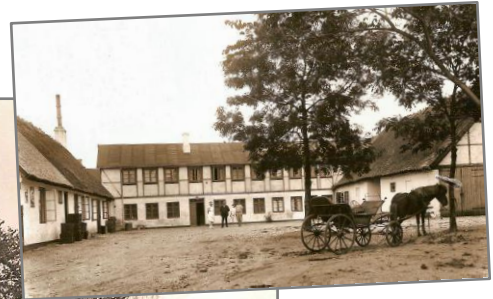
Hotel Bondegården i slutn. 1920'erne. Hovedindgangen lå der, hvor indgangen til SuperBrugsen er i dag. Kroen "Kanonen" (Den gl. Kanon) lå i gavlen mod syd langs Sauntevej. Ø Th.: Gårdspladsen fra samme tid - hovedbygningen havde fået en overetage på til værelser. Rejsestalden og haven til højre for gårdspladsen. Hornbæk Salonskydeselskab afholdt Fugleskydninger helt frem til 1929 i Bondegårdens have.