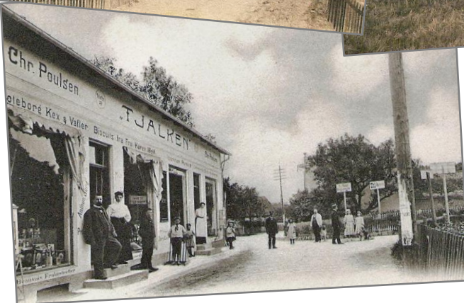
Tv.: Johannes Larsens bageri på Ole Piis Vej. Th.: Standvejen og Kirkevej. Det store hus tv. var Bendtsens Pensionat med pensionat Bag- gebo overfor i den lave have. Nederst: Tjalken - Havnevej og Strandvejen, der var skilte til Hornbæk Kro ad Havnevej og Hotel Bondegården rundt hjør- net til venstre. Hovedgaden ses lige ud !