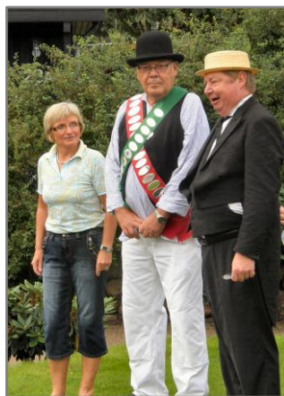
Kongen længe leve... hurra !