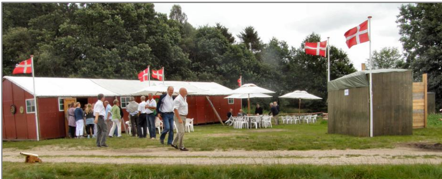
Jubilæums reception lørdag den 25. august 2007 - på skydeterrænet ved Stenhøjgård i Horneby.

Salonskydeselskabets 100 års dag d. 24. juli blev forbigået i tavshed, for bestyrelsen var da allerede i gang med at planlægge den helt store 100 års jubilæumsreception, hvor skydebrødrene med familie, og specielt inviterede gæster fra byen og lokale myndigheder, skulle deltage. Denne reception fandt sted lørdag d. 25. aug. 2007 i Skydeteltet på skydeterrænet ved Stenhøjgård i Horneby - dagen før årets Fugleskydning.