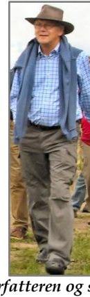
Forfatteren og sønnen på vej 40 år efter!

Så er der opbrud - en dejlig dag er forbi - nogle har sværere ved at komme hjem end andre.