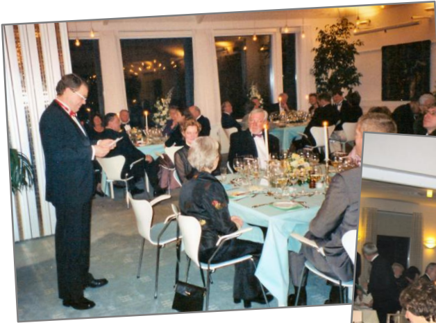
Tale til flaget - Havreholm Slot

Når vi så endelig ankommer, står alle gæsterne i deres fornemme tøj med en hidsig grøn velkomstdrink (Så havde vi alligevel valgt en forkert farve til kjolen!) og småsludrer, mens alle venter på, at platten afsløres. Vi søger sammen med dem, vi kender bedst. Derfor er det måske godt, at vi ikke selv må bestemme, hvor vi skal sidde.