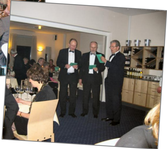
Th.: Sang til Fuglekongen - Hotel Bretagne

Under musikledsagelse går vi til de festligt pyntede borde. Her er der allerede skænket op med en dejlig kølig hvidvin. Vi hilser på hinanden og på Fuglekongeparret og ser frem til Dronningens tale. Det er altid spændende, for i årenes løb er der blevet sagt så meget pænt, og kan man mon blive ved med at finde på mere? Det kan man.