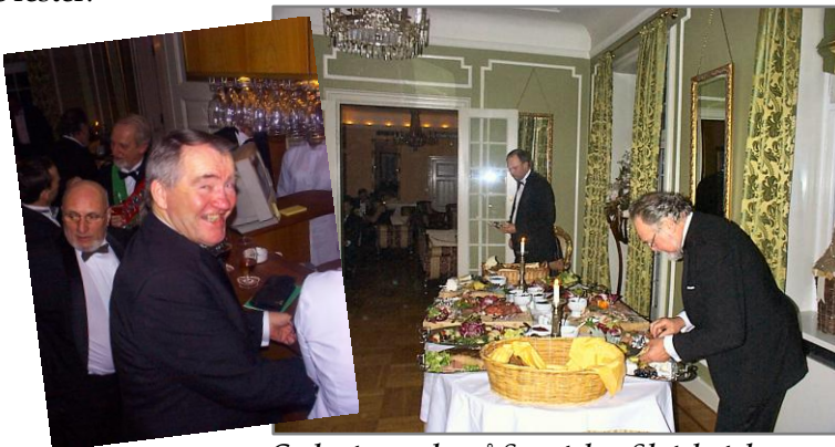
Godnat - mad - på Sauntehus Slotshotel.

Efter natmaden er det altid spændende, om man kan finde sin frakke, inden man begiver sig ud i sne og slud efter endnu en dejlig fest. Vi ser forventningsfuldt frem til de næste hundrede fester.