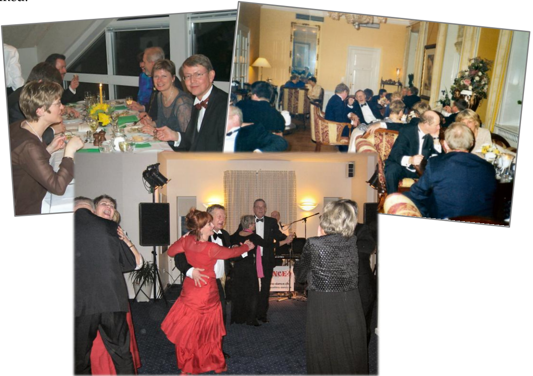
Ø.tv: Hornbæk Hallen Ø.th.: Sauntehus Slotshotel Herover. Hotel Bretagne

Efter kaffen, der bliver indtaget ved bordene, åbner Fuglekongen ballet. Så styrter mændene op i baren, inden vi kan nå at byde dem op til dans. Så må vi igen søge sammen med dem, vi kender bedst. Vi hygger os og snakker i smågrupper, mens musikken spiller i de tilstødende lokaler. Nogle siver lige så stille hjem, mens andre skal have det hele med.