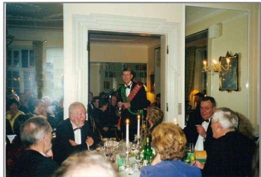
I 2000 og 2001 flyttede man Vinterfesten til Sauntehus Slotshotel.

Vinterfesterne i Saunte - på Sauntehus Slotshotel - var så langt fra byen, at Salonskydeselskabet lavede egen busforbindelse fra Hornbæk til Saunte - og der var shuttlebus i nattimerne, som sikrede at alle kom godt tilbage til Hornbæk.